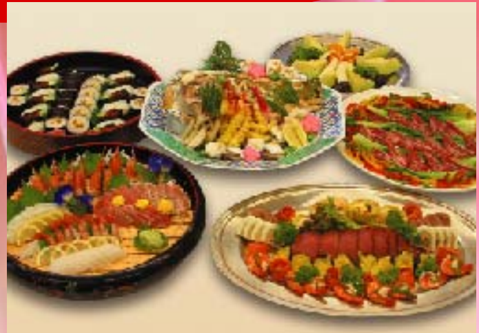
写真はオードブル/4,500円(8人盛) (5名様から承ります)